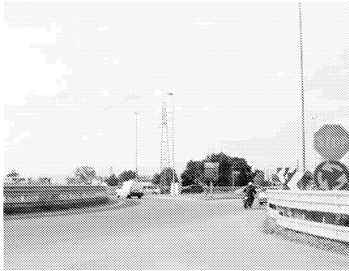
La rotatoria tra via Trattati di Roma e viale Città di Cutro, «in evidente stato di degrado ed insicura dal punto di vista della scarsa visibilità»