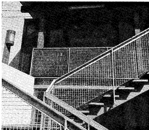
La scalinata che conduce all'ingresso della struttura

assegnazione ed esercizio da parte del nuovo gestore. In questa determina si dice chiaramente che il gestore avrà anche il compito di garantire la pulizia dopo ogni spettacolo, attività o manifestazione, ed ogniqualvolta risulti necessario, dei locali concessi in uso. Ma nulla di buono si prospetta all'orizzonte. Infatti, in questi giorni il sindaco Delrio ha dichiarato che la commissione giudicante, che deve ancora essere nominata, deciderà entro il 15 ottobre, nonostante per l'assegnazione dei locali del teatro si indichi la data