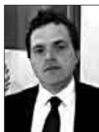
In alto Immo Villi. A destra uffici Enia e in basso l'albero caduto

Nel testo si sottolinea che «la crisi economica morde le famiglie, necessitando di urgenti ed inderogabili misure, su tutti i fronti di spesa e di contenimento dei costi di gestione, anche presso chi eroga servizi essenziali ai cittadini». Inoltre si fa presente che «il contenimento dei compensi dei manager IREN, sia come gettoni di presenza dei membri del Cda, sia come stipendi di Presidente, vicepresidente, Direttore Generale ed altri manager a capo delle diverse strutture, sia una importante misura di contenimento dei costi, che richiama la politica alle sue responsabilità in questa