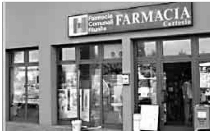
Una farmacia comunale