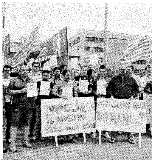
La protesta davanti al magazzino di via Pertini