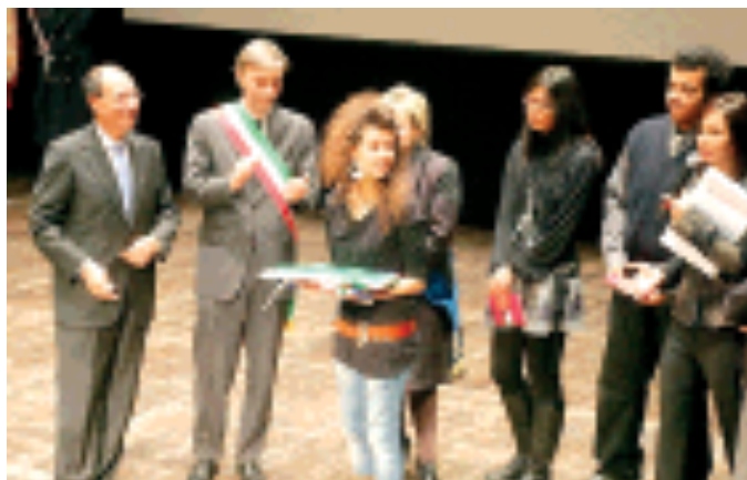
Un momento della cerimonia di ieri al Teatro Ariosto

Il presidente del Senato: «Sì ma senza webcam». Il comico: «Allora niente»