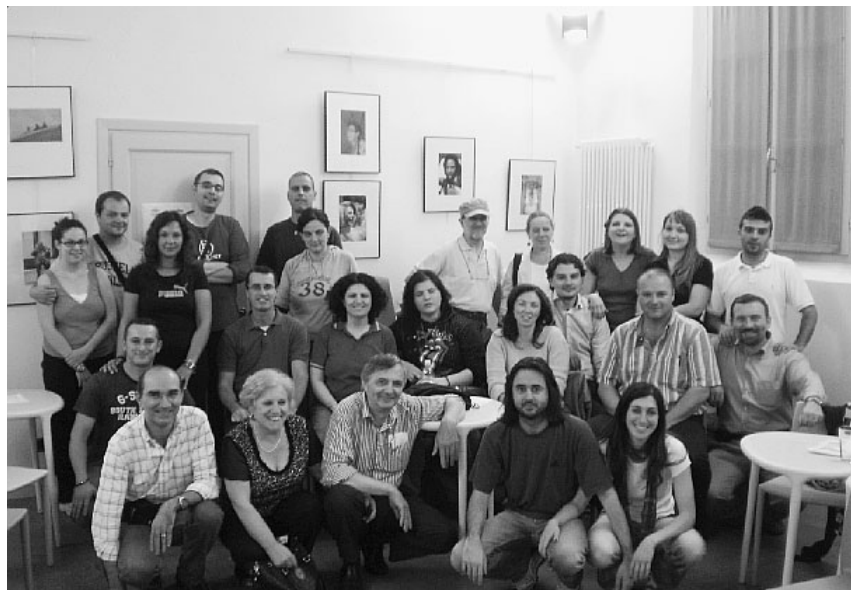
Il Gas (Gruppo di Acquisto Solidale) degli Amici di Beppe Grillo

Ma il gruppo ha anche altre campagne per sensibilizzare la popolazione ed i politici su un consumo più giusto, meno costoso e nel ri-