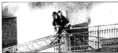
I vigili del fuoco al lavoro sul secondo incendio

Tutti i libretti nominativi e al portatore lasciati negli uffici reggiani. Ignoto l'importo, i termini scadono il 28 agosto