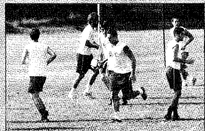
La Reggiana in allenamento