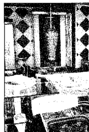
L'interno di un kebab

REGGIO. «Per noi non cambia niente, alcolici non ne vendiamo». Così alcuni gestori di kebab della città commentano l'ordinanza su questo genere di locali annunciata dal sindaco. E intanto, però, litigano tra loro e si accusano a vicenda proprio a proposito della vendita degli alcolici e del mancato rispetto degli orari. Intanto anche ieri, nella zona della stazione, sono proseguiti i controlli della municipale. Sul nostro sito Lettorio si schierano con De'rio. FORLEO A PAGINA 12 E SU WWW.GAZZETTADIREGGIO.IT