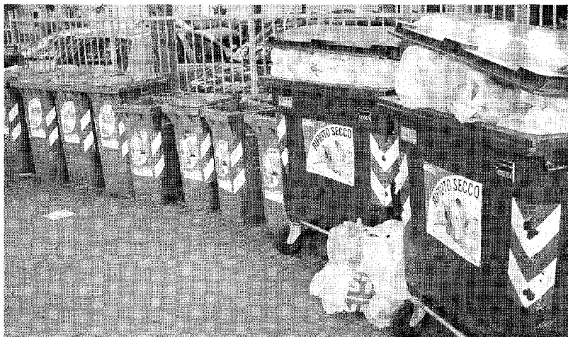
I cassonetti del sistema di raccolta rifiuti denominata «porta a porta»

L'APPELLO DELL'AVIS I donatori non crescono ma sale il bisogno di sangue