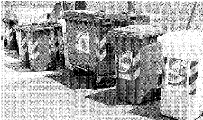
I cassonetti per la raccolta differenziata porta a porta davanti a una palazzina della VII Circoscrizione