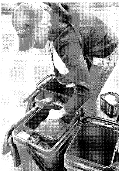
Un tecnico distribuisce i raccoglitori per la raccolta porta a porta